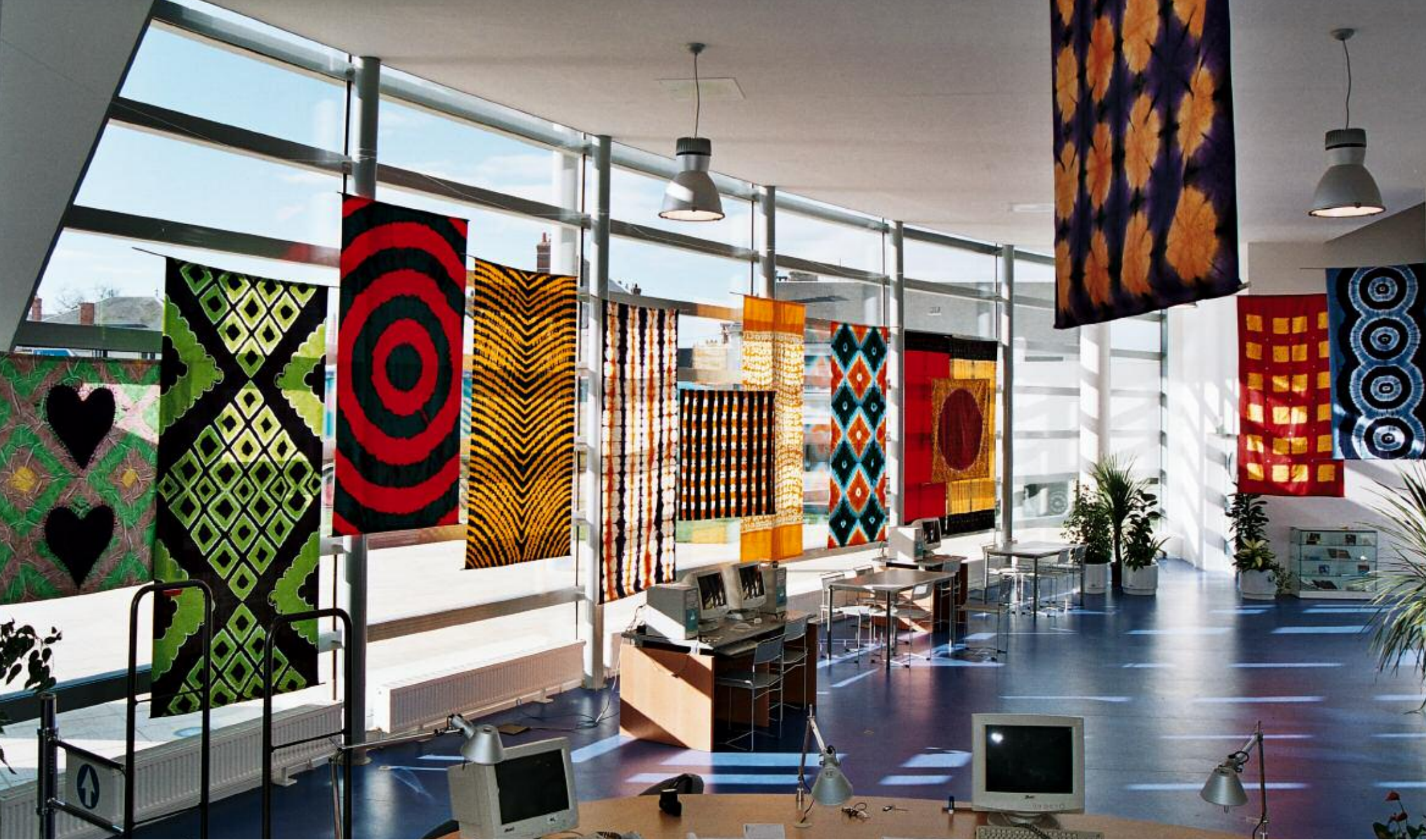
Médiathèque de Châteaudun, vue partielle de l'installation.