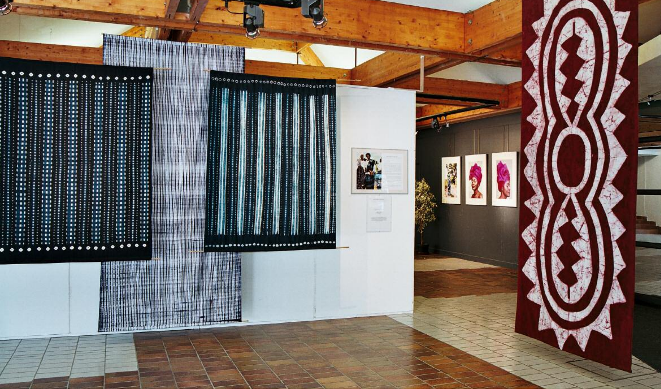
Espace Culturel d'Issoudun, vue partielle de l'installation.